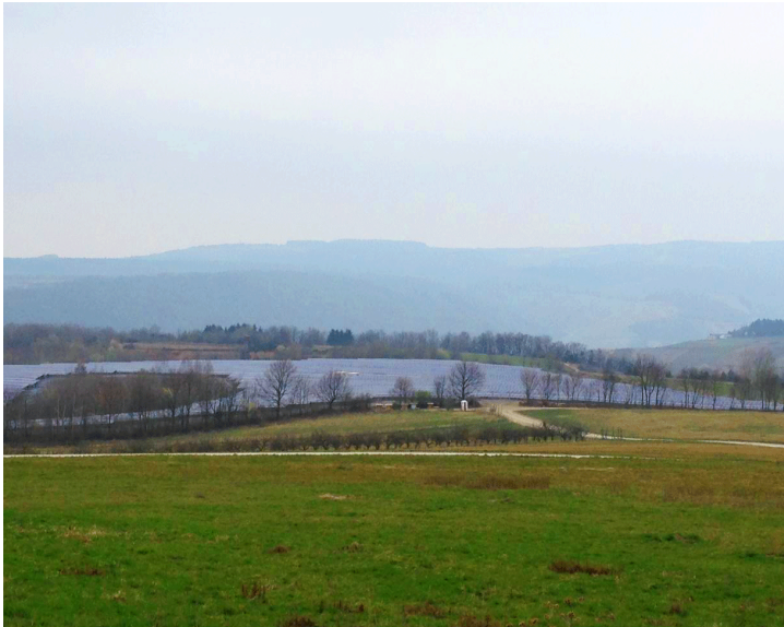
Neumagen-Dhron / 2.898 kWp / In Betrieb seit 2014.01

Derzeit können Sie sich mit bis zu zwei Anteilen an unserer Energiegenossenschaft beteiligen. Sobald ein neues Projekt in Aussicht ist und die erforderlichen Genehmigungen vorliegen, dann kann die Mitgliedschaft auf bis zu 30 Mitgliedsanteile aufgestockt werden. Eine Nachschusspflicht ist gemäß der Satzung ausgeschlossen.