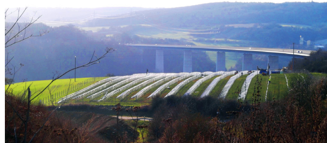
Langsur-Mesenich / 3.122 kWp / In Betrieb seit 2013.07

info@treneg-trier.de +49 (0)651 170 56 64