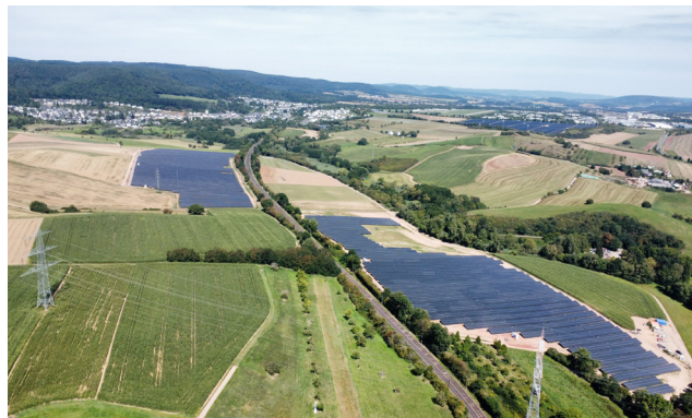
Schweich / 21.216 kWp / In Betrieb seit 2025.11

Weitere Informationen zu den Genossenschaftsanteilen entnehmen Sie der folgenden Seite.