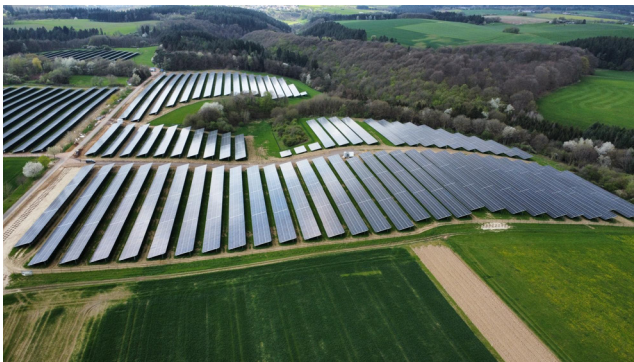
Minderlittgen / 23.964 kWp / In Betrieb seit 2024.06

Die PV-Anlagen erzeugen mit der produzierten Strommenge 2025 genug Strom für mehr als jeden zweiten Haushalt in Trier.